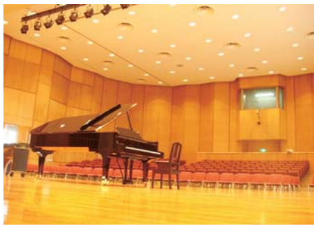
ヴィオーラホール (330席)