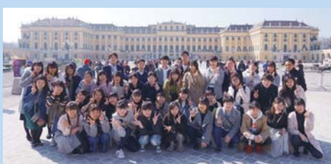
シェーンブルン宮殿