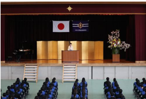
P T A 会長祝辞