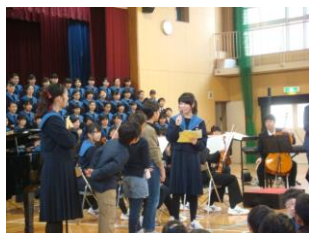
五条小学校 音楽交流会