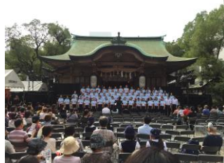
せんば鎮守の杜音楽祭