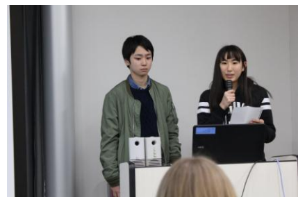
○水泳部からの挨拶