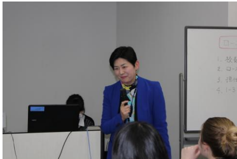
○帰国する留学生の発表