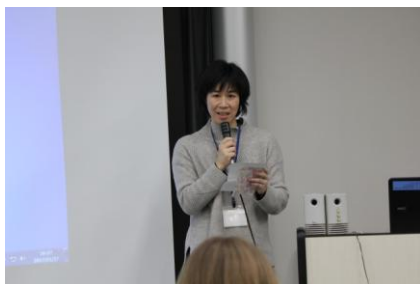
○担任の先生からの挨拶