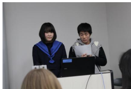
○クラスメイトからの挨拶